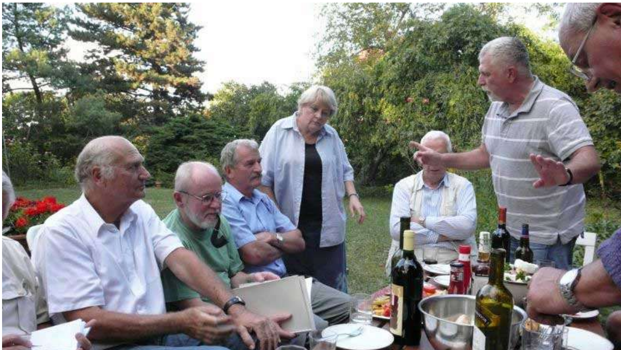
Na schůzce v r. 2009, opět na zahradě u Káji.