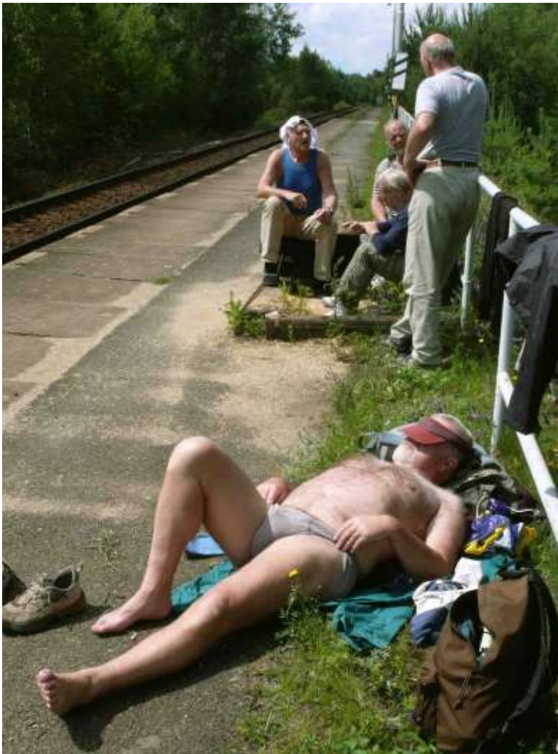
Louln čká na vlak