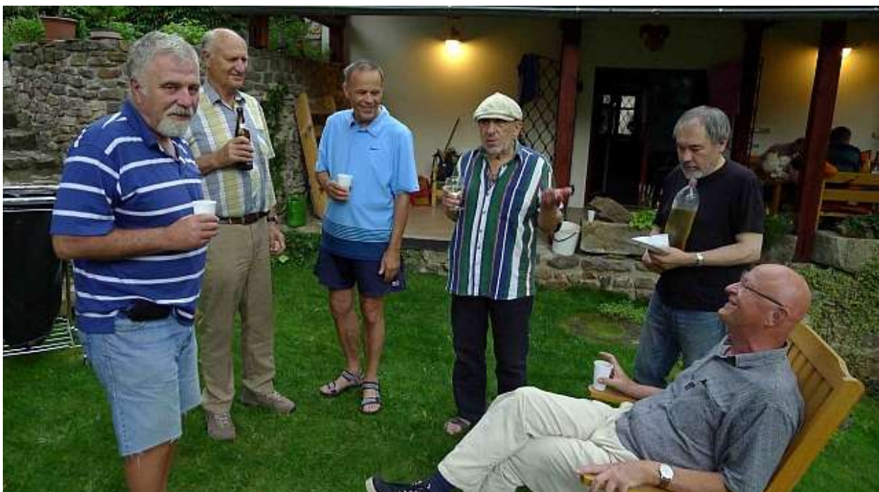
U Kačky ve Všenorech v červenci 2011, kde jsme se, jako vodáci, i koupali: