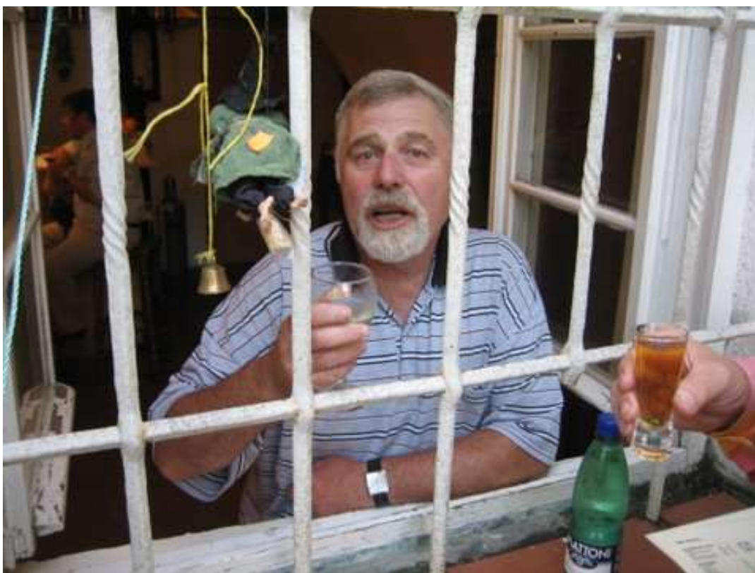
Za mřížemi na Kampě v r. 2011