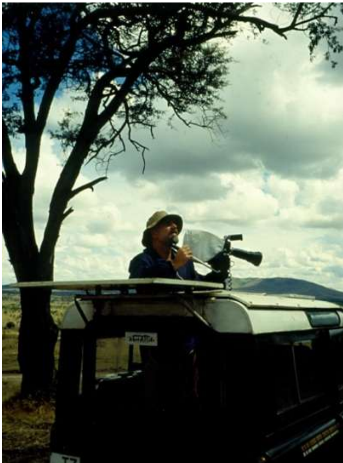
Pracovně v Africe 1978.