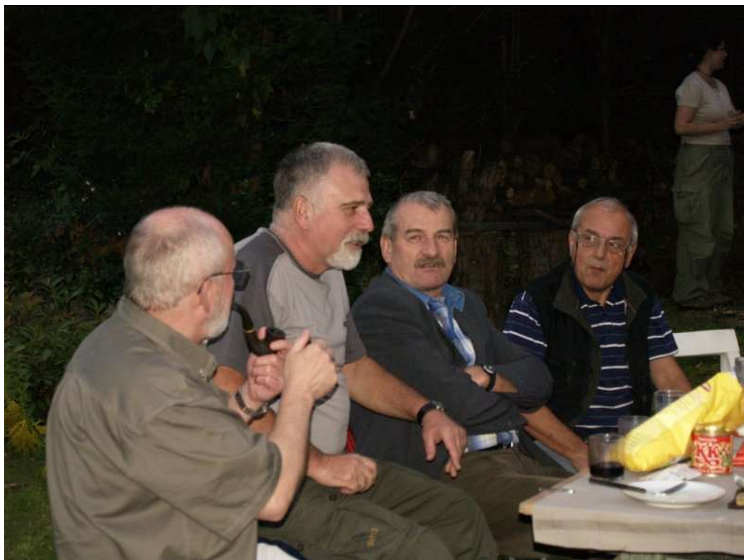
Na zahradě u Káji v září 2006.