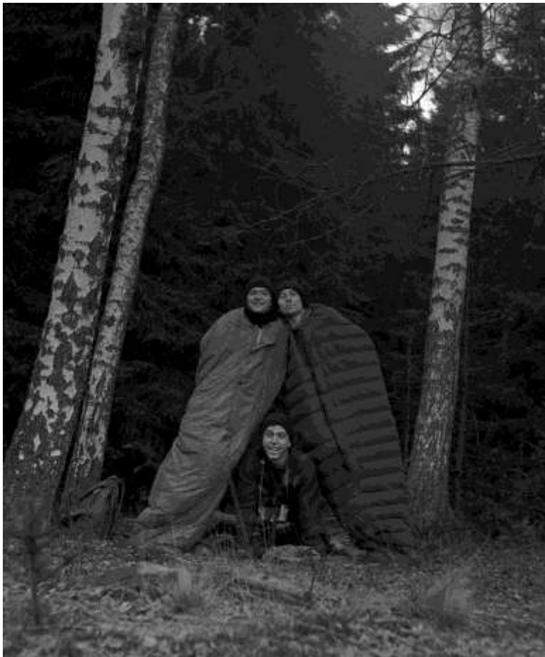
Výlet v Mokrovratech