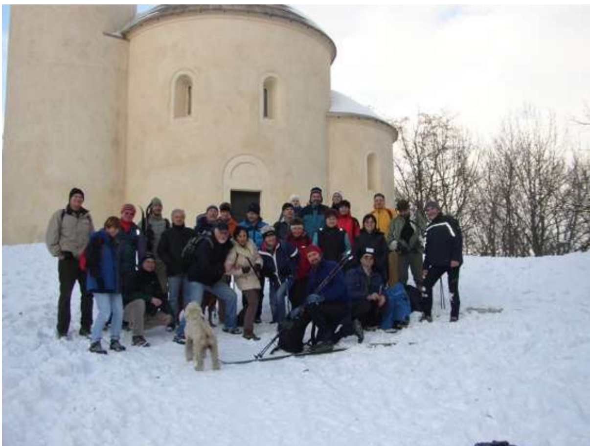
Memoriálníci a spol.s Loulnem na tradičním výstupu na Řííp při prvním ročním úplňku v r. 2010