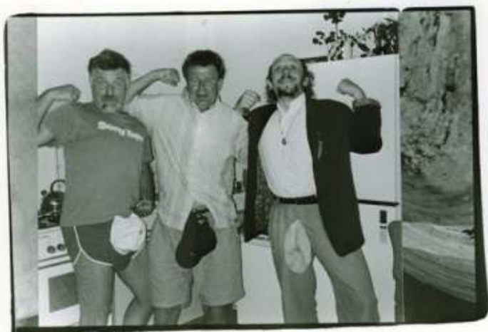
Věčná kamarádství: Na fakultě a potom v praktickém životě.