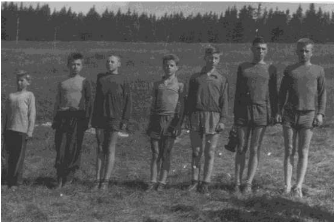
S Jespáky na Skočce v Krkonoších v r. 1958