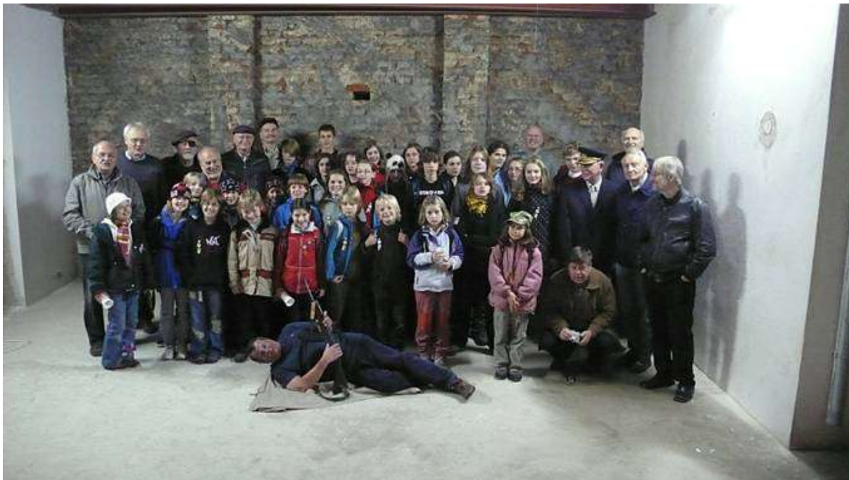
Louln s Prvostředečníky a s malým oddílem po detektivce.