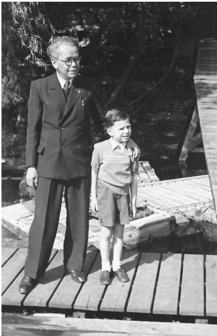
Loulín s Braťkou v r. 1950

A tak si zavzpomínejme na to, jaký byl a co jsme s ním prožili.