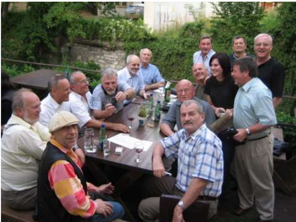
Na schůzce před mřížemi