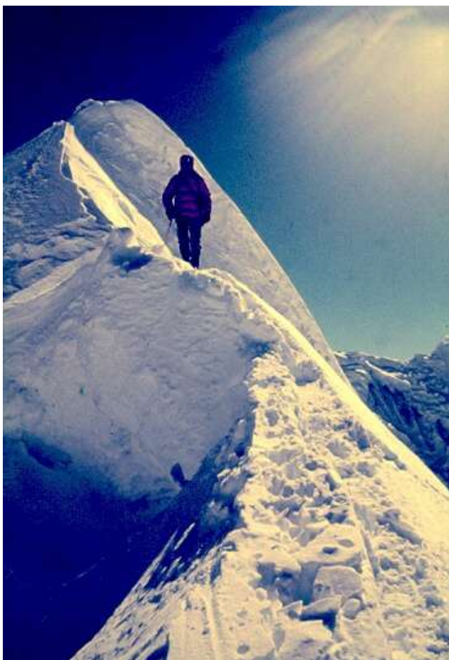
Na Poschamo ve výšce 6272 m v r. 1978.