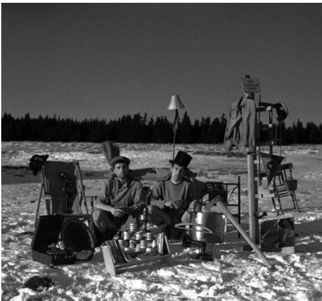
Loutky na klínovkách v r. 1960