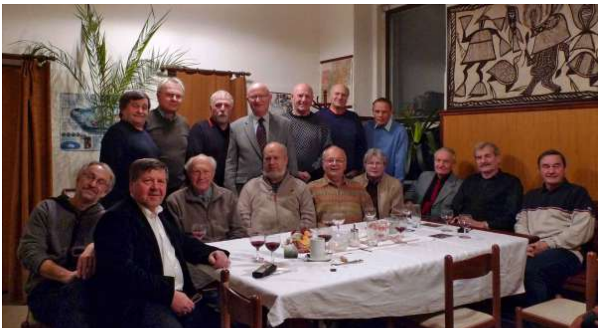
Na schůzce v Přírodovědném klubu v r. 2010.