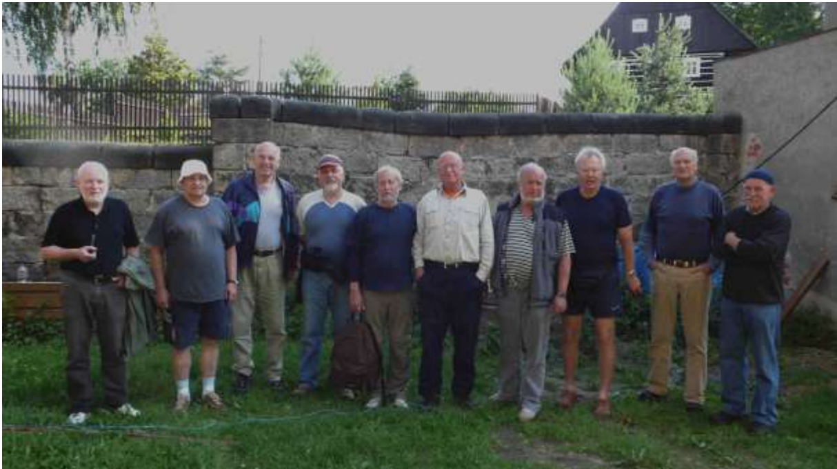
Na konci plavby jsme už vypadali svěže.